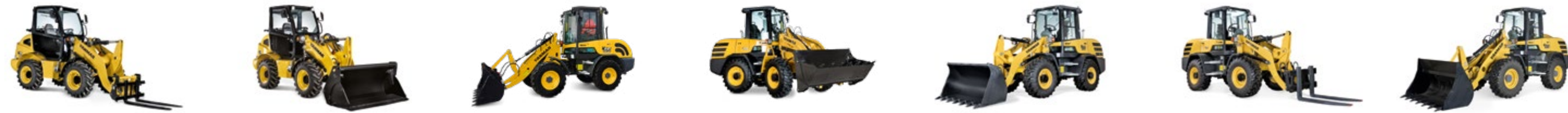
V7 V8 V65 V70S V80 V100 V120