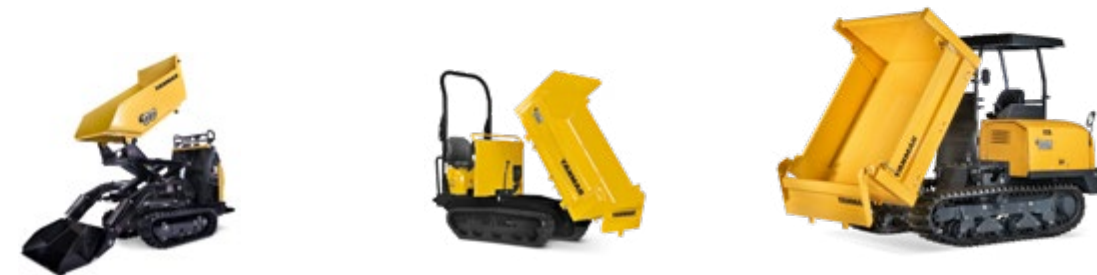
C08 C12R-B C30R-3 / C30R-3TV