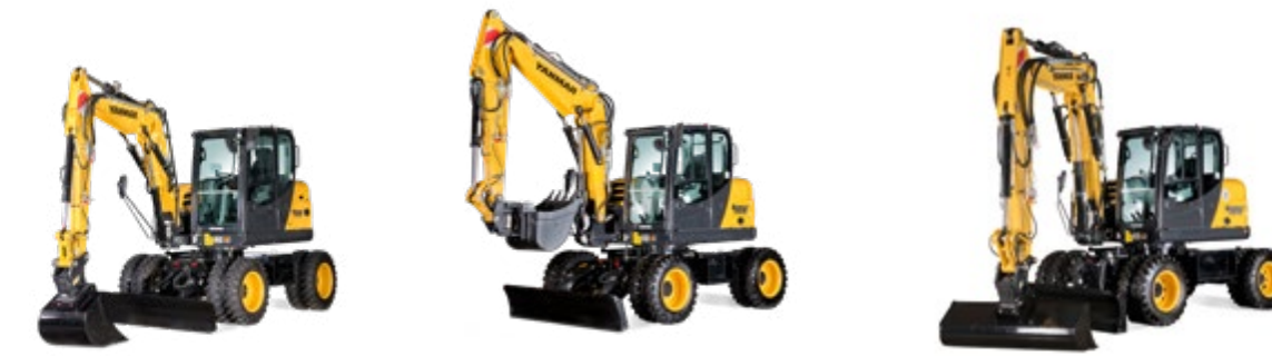
B75W B95W B110W