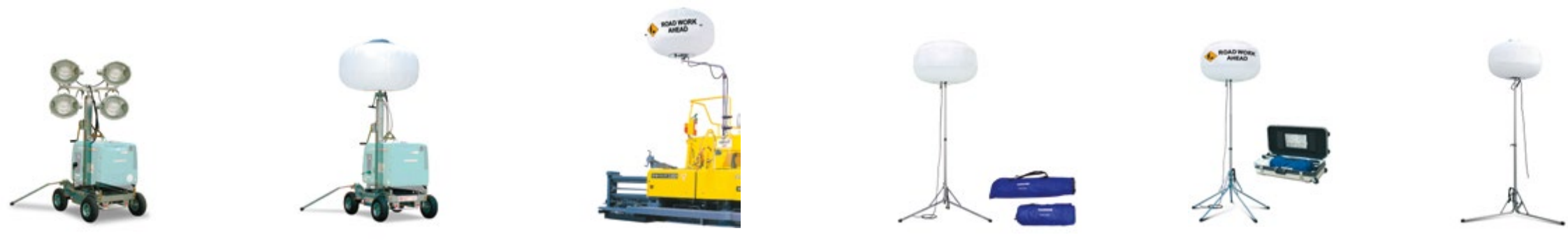
43SD 113BD 103BS 43BW 103BH / 103BW 30BH / 30BW