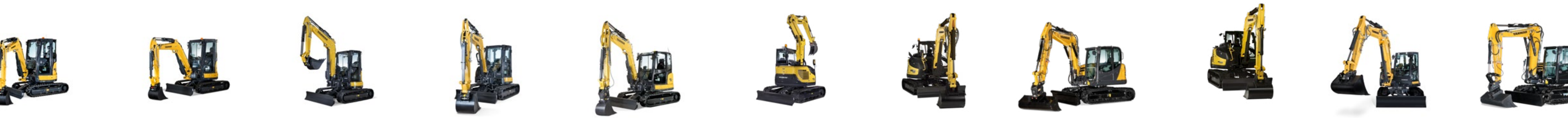
VIO33-6 VIO38-6 VIO50-6 VIO57-6 SV60 B7-6 VIO80-1 SV85 SV100-2 SV100-2PB SV120